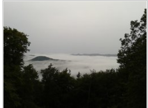
Nebel im Tal; Blick vom Eyberg

Die Tour beginnt in der Dahner Straße in Fischbach. Wir folgen ihr ortsauwärts. Die ruhige Verkehrsstraße verengt sich immer mehr und wird zur Waldstraße. Nach ca. 2 km geht diese am "Saupferch" in einen Schotterweg über. Das lockere Einrollen hat ein Ende und es beginnt die erste Steigung auf einer Schotterpiste. Nach den ersten 150 hm und den ersten Schweißtropfen gehts auf einen herrlichen Singletrail weiter berghoch. Der Singletrail würde zwar bis zum Eyberg hochziehen - das letzte Stück ist aber für "Normalsterbliche" nicht fahrbar, sodass wir einem fahrbaren Waldweg den Vorzug geben. Die Besteigung des Eybergturms versteht sich von selbst. Runter gehts auf einem supergeilen Singletrail bis an eine kleine Schutzhütte. Jetzt wieder auf einem schönen Waldweg leicht bergab bis zum Napoleonsfelsen und weiter durch herrliche Buchenwälder zum Einstieg des nächsten Pfades. Auf rasanter Fahrt runter auf den Radweg, der uns auf einer Holzbrücke ins Sautertal führt. Weiter gemütlich zum Biosphärenhaus und nach Fischbach zurückführt.