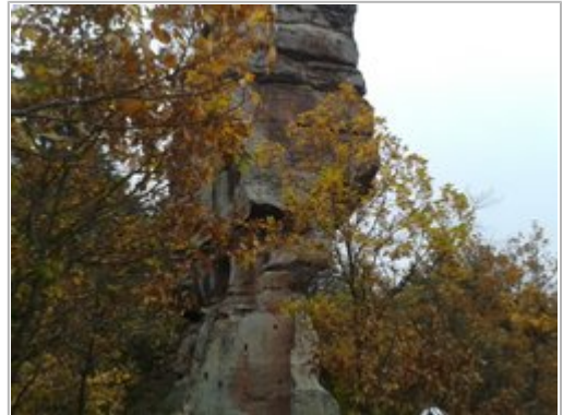
Klettertoru am alten Windstein