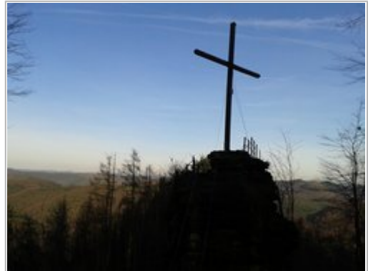
Friedenskreuz auf dem Maimont